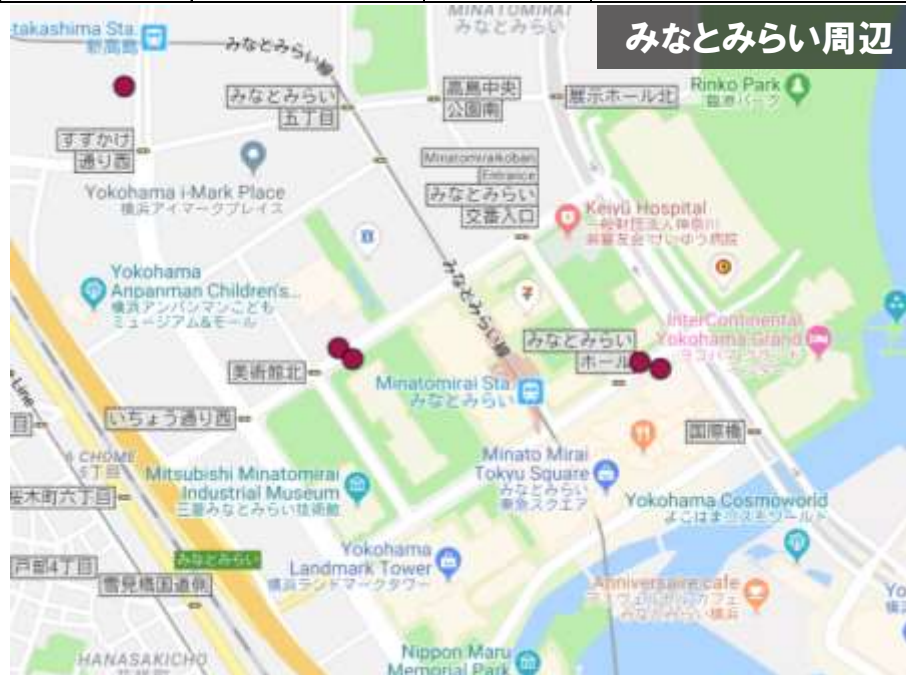
みなとみらい周辺