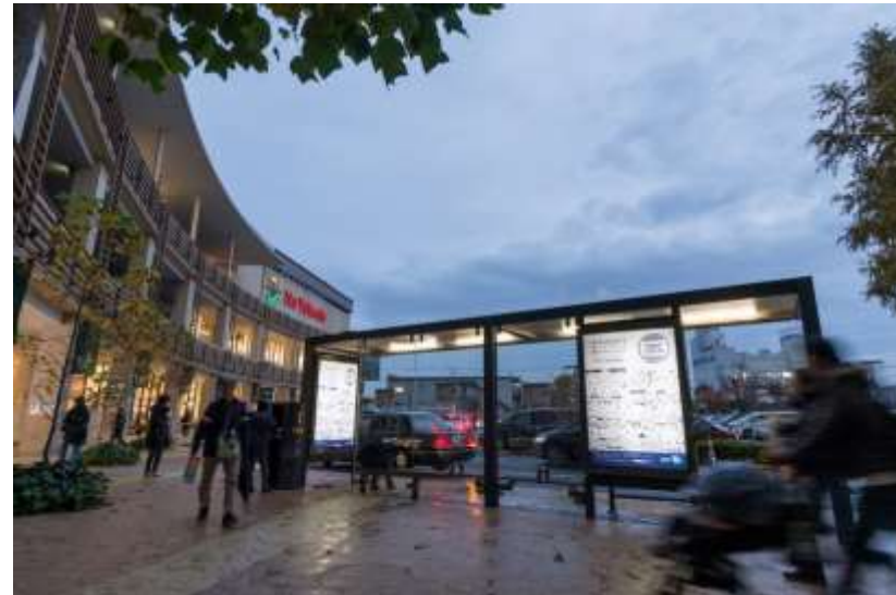
■American Express様 2017年 11月