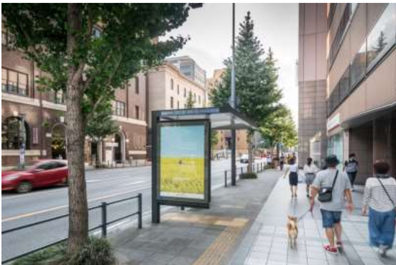
■AMAZON様 2017年 9月