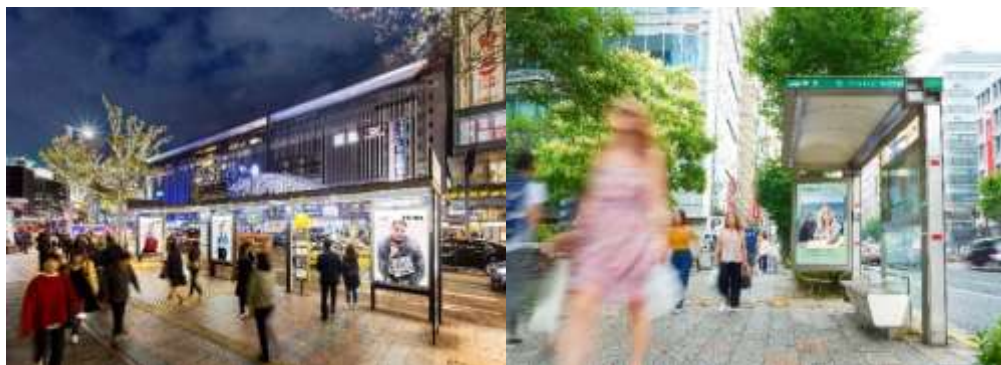
シテースケープ®の仕様

シテースケープ®は、主要40都市に展開する 全国ネットワークの唯一のOOHメディア です。 歩行者やバス利用者、自動車のドライバーまで様々な移動シチュエーションで広告を到達させる“ マチメディア ”です。 各都市の中心部・大通り沿いに接しており、生活者の生活動線上に設置しているため、掲出期間中の 接触回数も多く 、“ 印象に残りやすい ”という特徴があります。 夕方から翌朝まで内照パネルが点灯するため、 24時間稼動 する上、夕方以降は インパクトのある訴求 を可能にいたします。