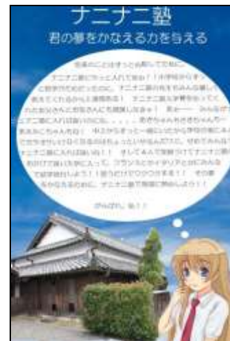
細かすぎる文字情報