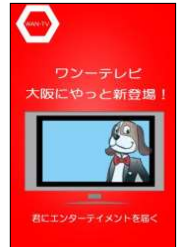
背景色の赤が高彩度