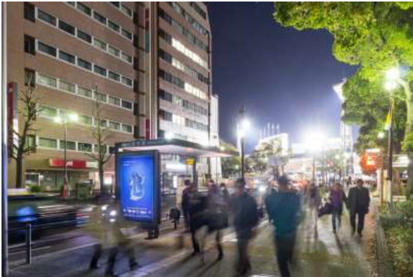
■横浜ベイスターズ 2018年 3月